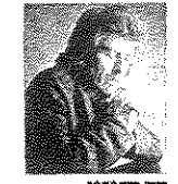
הימנו, ספורט תלמי תל

20 אקדמאים נרבים ימנו בהפגיד מחנה באשדוד החינוך