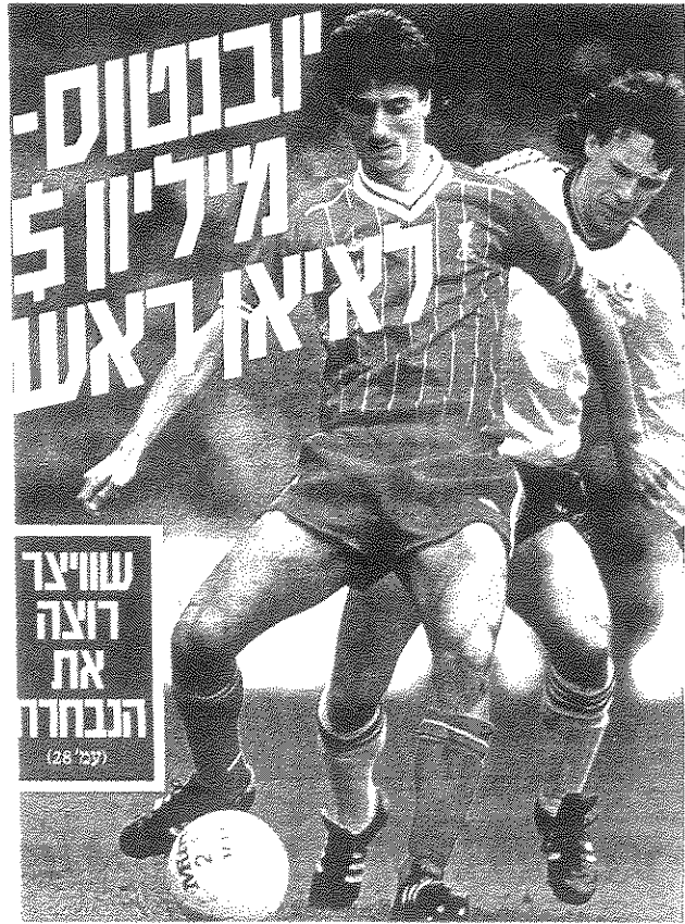
שווייץ רצה את הנחמד (עמ' 26)